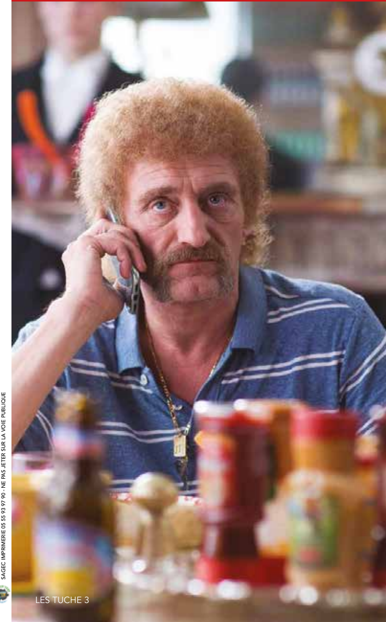
LES TUCHE 3